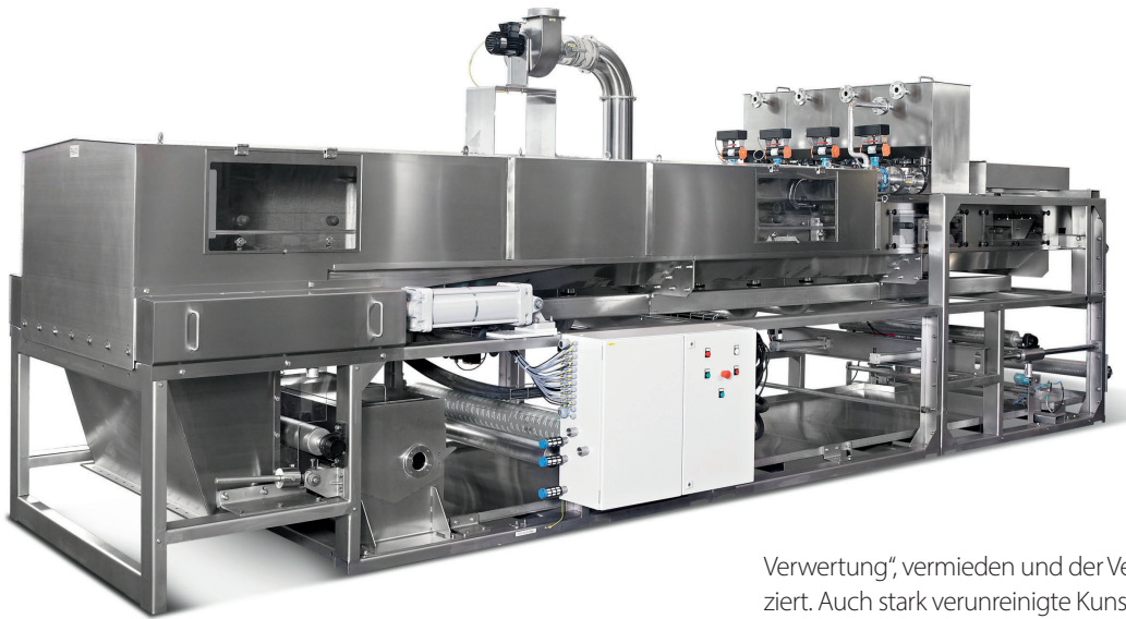
Bild 2. Der BHS-Taktbandfilter ist in Edelstahl ausgeführt und unterstützt eine mehrfache Gegenstromwäsche.