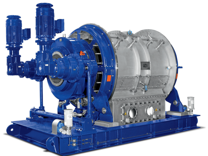
Bild 3. Für den Einsatz beim chemischen Recycling von PET ist auch Druckfiltration geeignet, etwa durch den Druckdrehtfilter RPF.

Read the English version of the article in our magazine Kunststoffe international or at www.kunststoffe-international.com